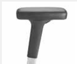
A442APO (4F) Leder-Armauflagen Leather armpads