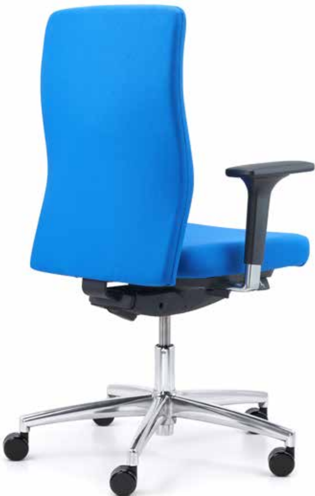
TA SM 9609 operator + Armlehnen | Armrests A441APO QS SM 9607 operator