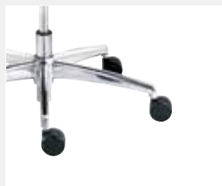
FFAPO Aluminium poliert (Option) Polished aluminium (option)