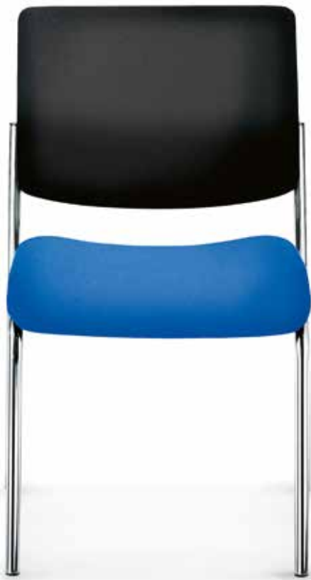
SM 9105 Armlehnen | Armrests AB04KGS (6fach stapelbar | stackable up to 6-high)