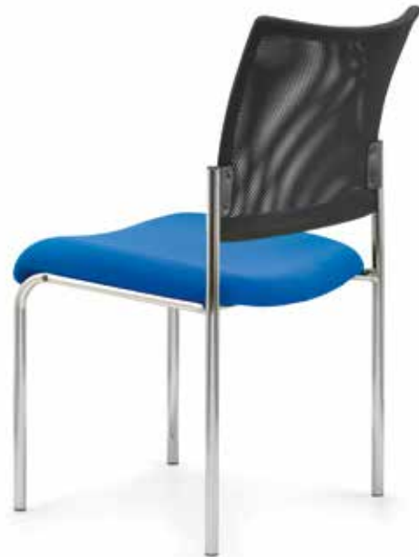
SM 8105 (6fach stapelbar | stackable up to 6-high)