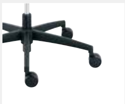
FFKGS Kunststoff schwarz (Standard) Black plastic (standard)