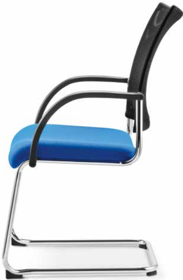
SM 8110 Armlehnen | Armrests AB04KGS (3fach stapelbar | stackable up to 3-high)

With their comfortable fully upholstered or mesh backrests, the four-legged chairs and cantilever chairs offer excellent seated comfort for guests and visitors and are the ideal accompaniment to the range of operator office swivel chairs.