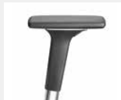
A541APO (5F) Armauflagen PU soft Armpads PU soft

*mit antibakterieller Mikrosilberausstattung zum Schutz vor Infektionen with antibacterial microsilver finish to help prevent infections