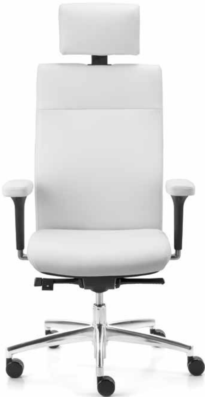
QS SM 9639 executive + Armlehnen | Armrests A442APO

The fully upholstered executive swivel chairs impress with their striking upholstery look in defined fabric qualities or fine leather. The backrests are height-adjustable (7 cm using the so-called Easy-Touch-System) and can easily be adjusted without any buttons. An attractive, matching cantilever chair rounds off the swivel executive chair range perfectly.