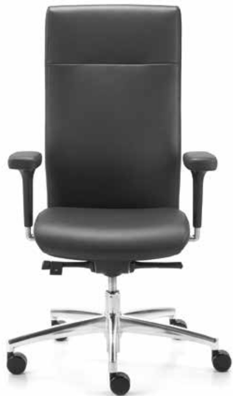
QS SM 9636 executive + Armlehnen | Armrests A442APO