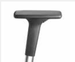
A341APO / A441APO (3F/4F) Armauflagen PU soft Armpads PU soft