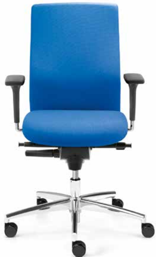
BS SM 9607 ST operator + Armlehnen | Armrests A441KGS