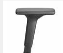
A441KGS (4F) Armauflagen PU soft Armpads PU soft