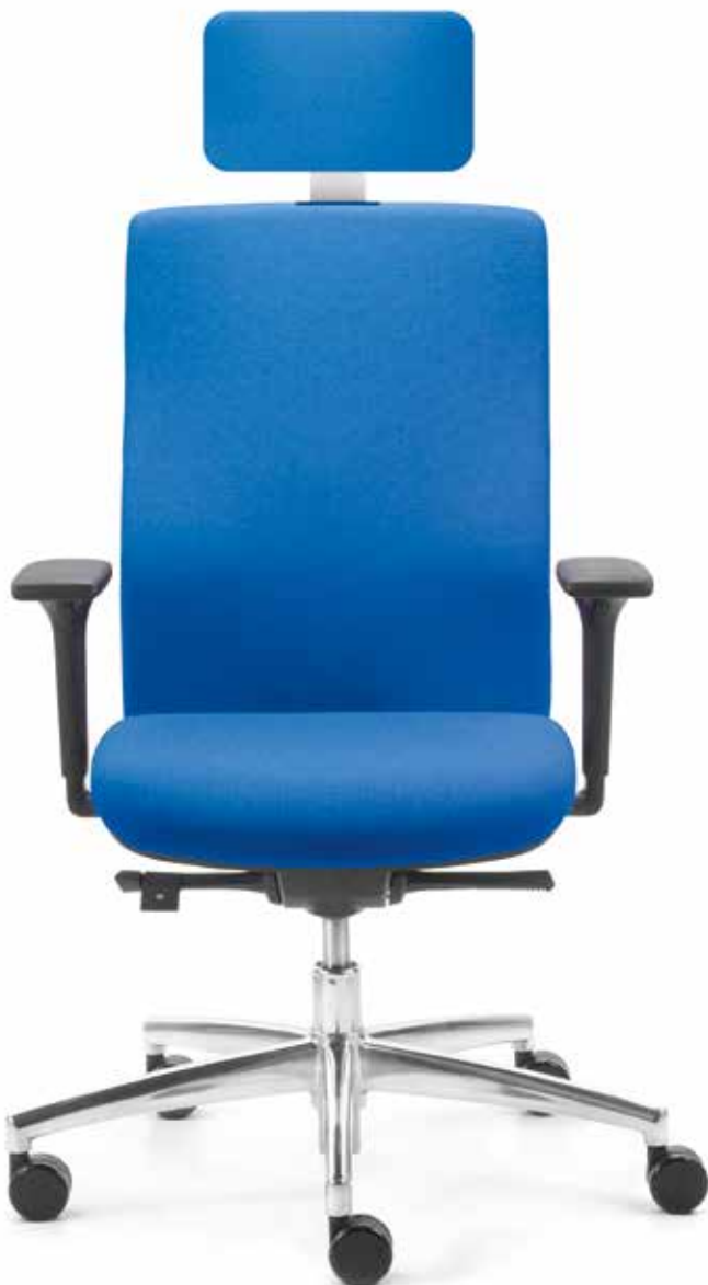
QS SM 9627 operator + Armlehnen | Armrests A441APO

The slim and elegant shape of the fully upholstered backrests provides optimal support when working, thanks to the anatomical backrest contour and full ergonomic specification.