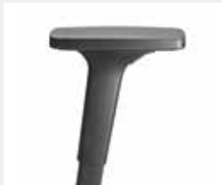
A240KGS (2F) Armauflagen PU Armpads PU