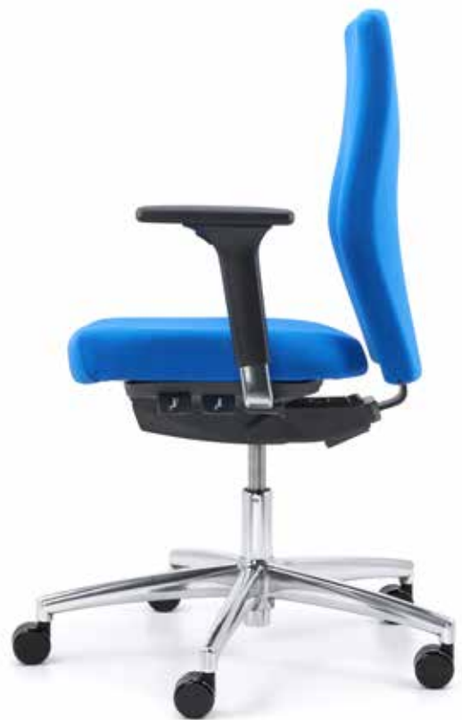
TA SM 9599 operator + Armlehnen | Armrests A441APO QS SM 9595 operator