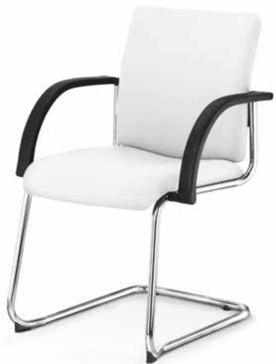
SM 9603 (3fach stapelbar | stackable up to 3-high)