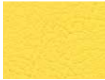
006.001 Leuchtgelb Luminous yellow