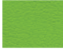
006.010 Grün Organic green