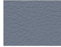
006.030 Grau Metal grey