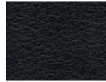
006.033 Schwarz Midnight black