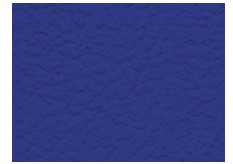
006.020 Standardblau Classic blue