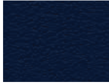
006.022 Dunkelblau Deep blue