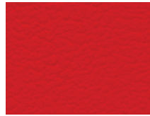
006.040 Chillirost Chilli red