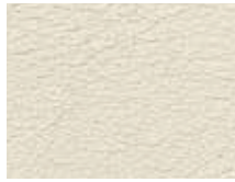
006.070 Polarweiß Arctic white