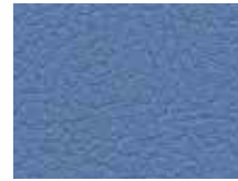
006.025 Wasserblau Lagoon blue