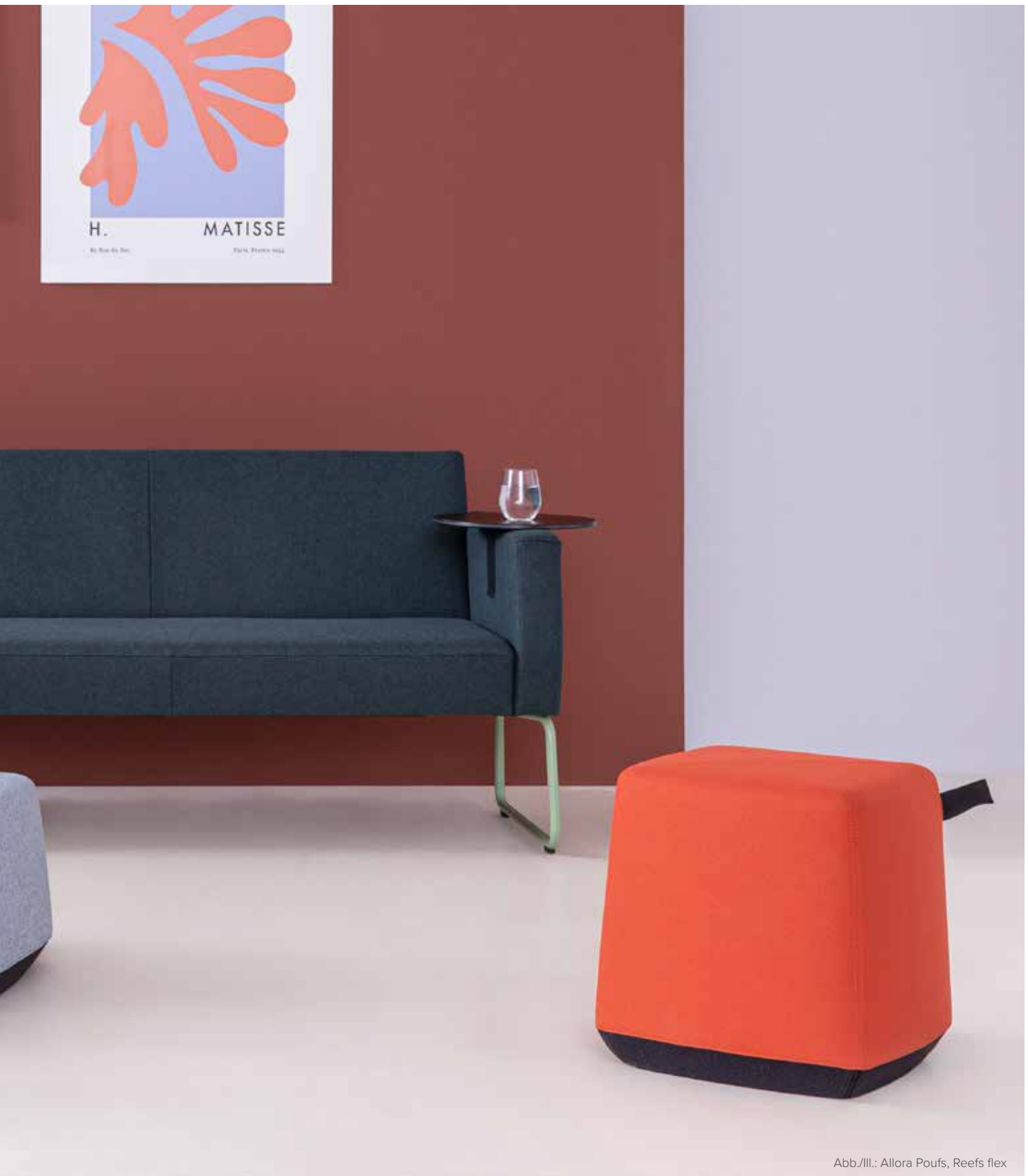
Abb./III.: Allora Poufs, Reefs flex

Drei Größen. Trendstarke Farbvielfalt. Unzählige Kombinationsmöglichkeiten! Wo die Allora Poufs im Team auftreten, sind der Kreativität kaum Grenzen gesetzt. Stellen Sie Ihre ganz eigene Sitz-Landschaft zusammen – passend zu Ihrem Ambiente. Passend zu Ihrer Corporate Identity. Die stylishen Hocker strahlen einen unkonventionellen Charme aus, der immer wieder aufs Neue inspiriert und Feel-good-Atmosphäre für Gäste wie Mitarbeiter verbreitet.