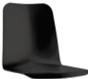
Schale 443 443

Hiller Objektmöbel GmbH Kippenheimer Straße 6 77971 Kippenheim | Deutschland T +49 (0)7825.901 -0 | F +49 (0)7825.901 -201 www.hiller-moebel.de | contact@hiller-moebel.de