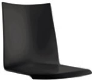
Schale 443 442