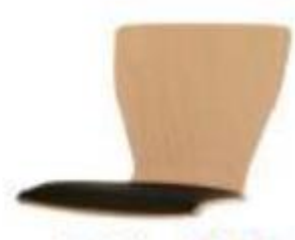
Schale 66 79

Hiller Objektmöbel GmbH Kippenheimer Straße 6 77971 Kippenheim | Deutschland T +49 (0)7825.901 -0 | F +49 (0)7825.901 -201 www.hiller-moebel.de | contact@hiller-moebel.de