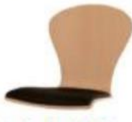
Schale 66 59