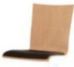
Schale 66 40