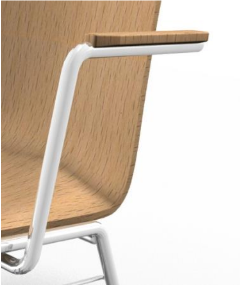
Armlehne SG Massivholzauflage