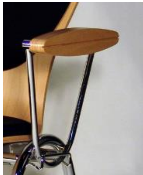
Armlehne 36 Holz

Hiller Objektmöbel GmbH Kippenheimer Straße 6 77971 Kippenheim | Deutschland T +49 (0)7825.901 -0 | F +49 (0)7825.901 -201 www.hiller-moebel.de | contact@hiller-moebel.de