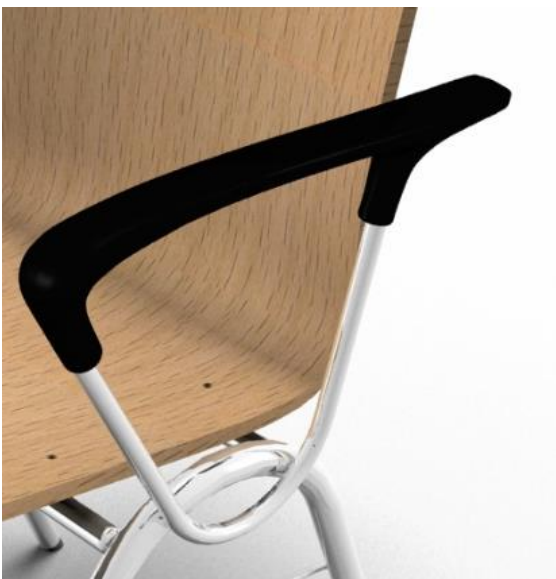
Armlehne 55 Kunststoff